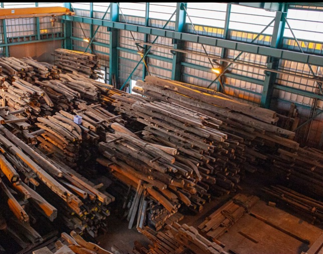
株式会社山翠舎 山上 浩明